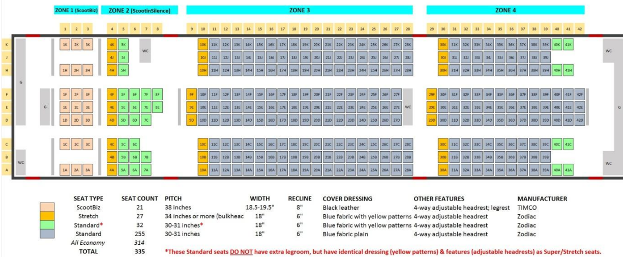
787-8 Seat Product Information

2. ค่าที่พักห้องละ 2 ท่านตามโรงแรมที่ระบุไว้ในรายการหรือระดับเทียบเท่า กรณีเดินทาง 3 ท่านจะเป็นห้อง Triple จะเป็นแบบเตียงเดี่ยวสามเตียงหรือแบบเตียงใหญ่ 1 เตียงเตียงเดี่ยว 1 เตียง เป็นการจัดแบบเตียงของทางโรงแรมไม่สามารถระบุได้ กรณีโรงแรมมีห้อง Triple ไม่เพียงพอ ขอสงวนสิทธิ์ในการจัดห้องให้เป็นแบบ แยก 2 ห้อง คือ 1 ห้องพักคู่ และ 1 ห้องพักเดี่ยว โดยไม่ค่าใช้จ่ายเพิ่ม